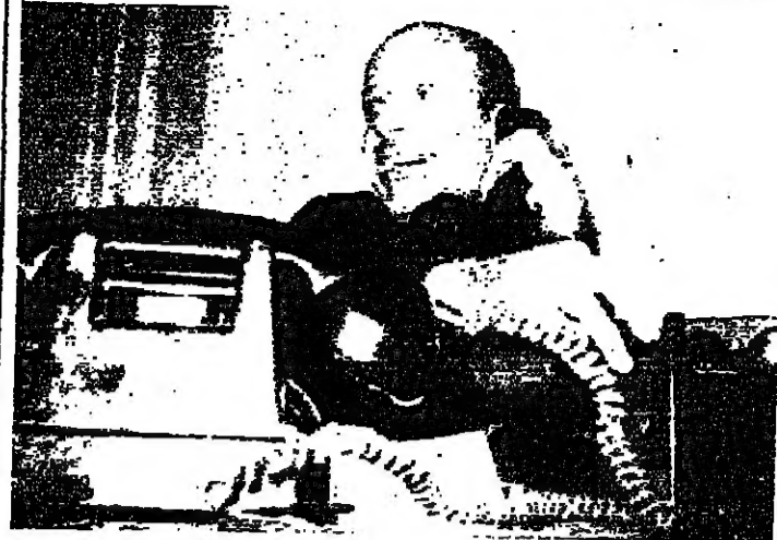
شريف الاخي كان امس مضافاً مع من تتاوله هذا بالانتماء الى

خدم يصل طهران غداً... اذاعة سرية في زحلة... الكتاب تبهم "فرقاء" بعرقلة اي اتفاق أو حل